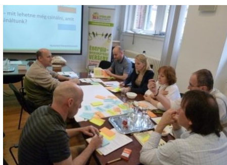
Készül a lista, mit csinálnak már most is jól az épületben, és mi az, amire jobban oda kell figyelni a jövőben.

A GreenDependent Intézet munkatársai fontosnak tartották azt is hangsúlyozni, hogy miért kell az éghajlatváltozás ellen fellépni, és miért is éppen a közsférának szól ez a verseny. Ezen kívül beszéltek a csoportdinamikáról és motivációról, valamint a versenyzők rendelkezésére bocsátott eszközökről (pl. energiafogyasztás-mérő, hőmérséklet- és páratartalom-mérő, kikapcsolásra figyelmeztető matricák, logós bögrék és vászonszatyrok). Az előadások között „pihenésképpen” pedig a résztvevők a helyszínbemjárásakor támadt ötleteiket rendszerezték, és csoportmunkában megfogalmazták a majdani feladatokat, ami végül majd egy akciótervet fog eredményezni. Polgármesterek, önkormányzati referensek és takarítók együtt törték a fejüket, hogyan tudnának energiát spórolni az épületüknek, és fenntarthatóbb jövőt teremteni embertársaiknak, valamint az elkövetkező generációknak. A képzés az első lépést jelentette az egyéves munkában, és a remények szerint 2017 februárjában a verseny végeztével sem lankad majd az igyekezet. A dolgozók ráadásul a képzésen megszerzett tudás nagy részét otthonaikban is alkalmazhatják.