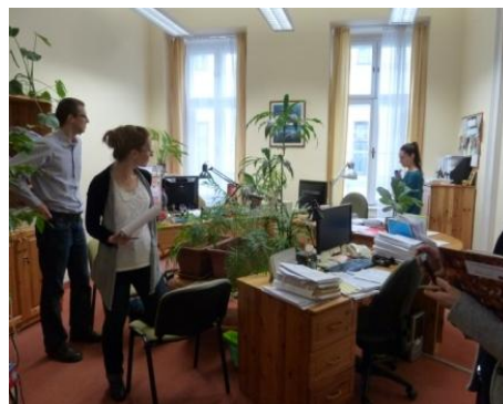
Jó példa: a sok növény kedvezően hat a páratartalomra, ezáltal a hőérzetünkre és hangulatunkra is.

A felkészítő képzést mindig egy-egy versenyző épületben tartotta a hazai projektpartner, a GreenDependent Intézet , az ország egész területén összesen tíz helyszínen. Minden épület különböző adottságokkal bír és eltérő szabályokkal, szokásokkal rendelkezik, így egy helyszínbemjárással kezdődött a program, amely során a szakértők az energiamegtakarítás szempontjából meghatározó jelenségekre hívták fel a résztvevők figyelmét. Közös szemrevételezték, hogy az irodákban, a mellékhelyiségekben vagy a teakonyhában mi az, amit már most is jól csinálnak az ott dolgozók, illetve min lehetne még változtatni a hatékonyabb energiamegtakarítás érdekében. Voltak olyan lelkes kollégák, akik azon nyomban meg is ragadták az alkalmat, hogy lekapcsoljanak egy lámpát, számítógépet, vagy átállítsanak egy csaptelepet, mérsékeljék a hőfokot a hathatósabb energiaspórolás érdekében.