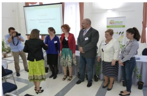
A legjobb kampány kategória nyertese, a Miskolci Polgármesteri Hivatal - Városház tér épületének dolgozói átveszik nyeresiményüket

A legjobb és legfenntarthatóbb akciótervet pedig a Miskolci Polgármesteri Hivatal kisebbik épülete, a Tatai Közös Önkormányzati Hivatal és az Alapvető Jogok Biztosának Hivatala munkatársai készítették.