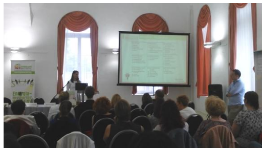
A legtöbb energiát megtakarító Pázmánd előadása

olykor lámpát kapcsolt, ablakot zárt, de mindenek előtt figyelmeztette a kollégákat, ha kellett, akkor pedig forró teával várta őket a hideg téli reggeleken. A jutalom sem maradt el, első helyezettként 150 ezer forint értékben kaptak utalványt, amelyet energiatakarékos eszközök vásárlására fordíthatnak, továbbá egy felelős étteremben költhetnek el megünnepelve a közös erőfeszítéseket. Ezen kívül ketten Brüsszelbe utazhatnak, hogy részt vegyenek a nemzetközi díjátadó rendezvényen. A polgármester asszony a takarító nénit választotta maga mellé utasnak, ezzel is kifejezve, hogy a klímaváltozás elleni küzdelemben mindenki hozzájárulása egyformán fontos.