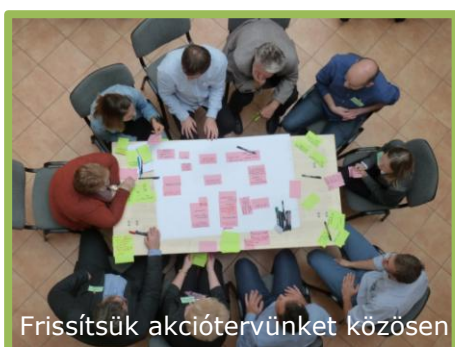
Frissítsük akciótervünket közösen